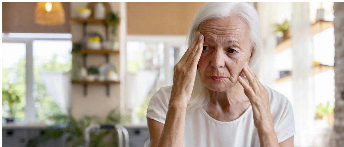
La hipertensión y la diabetes condicionan la salud de las personas mayores de 65 años.

Las personas mayores de 65 años sufren con mayor prevalencia el deterioro cognitivo asociado a factores de riesgo como el consumo de tabaco o la diabetes.