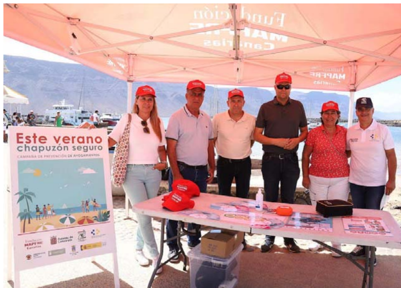
MÁS DE 1.400 PERSONAS PARTICIPAN EN LA CAMPAÑA DE PREVENCIÓN DE AHOGAMIENTOS 'ESTE VERANO CHAPUZÓN SEGURO'

Esta web utiliza cookies propias y de terceros para su correcto funcionamiento y para fines analíticos. Al hacer clic en el botón Aceptar, acepta el uso de estas tecnologías y el procesamiento de tus datos para estos propósitos. Ver